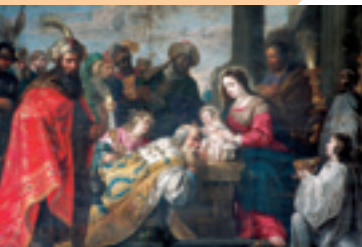
Iglesia de San Andrés. Reyes Magos y Bóveda

A tan sólo cinco kilómetros llegamos a Carrión de los Condes , citada ya en el Codex Calixtinus como “ villa próspera y excelente, abundante en pan, vino, carne y todo tipo de productos ”. Fue capital de los dominios de los poderosos Beni-Gómez y de los Infantes de Carrión, aquellos que la leyenda casó con las hijas del Cid. Cuna de ilustres literatos y místicos como el Rabí Dom Sem Tob, el Marqués de Santillana o Francisca Javiera del Valle. Aún conserva varias casas blasonadas, templos, ermitas y conventos de clausura que se pueden visitar. Entre ellos destacan: San Andrés, San Julián, Belén, San Francisco, la Cruz, la Piedad, San Juan de Cestillos, el Carmelo, Santa Clara, Santiago, Santa María y San Zoilo .