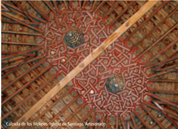
Calzada de los Molinos. Iglesia de Santiago. Artesonado

Después de salir del monasterio nos encaminamos hacia la zona llamada de la Cueva. Los peregrinos seguían hacia la antigua Abadía de Benevívere y cruzando sobre la Via Aquitana se encaminaban hacia Calzadilla de la Cueva. Nosotros seguiremos el trazado de la N.120 y llegaremos a Calzada de los Molinos , donde nos detendremos a ver la iglesia de Santiago, con un bello artesonado mudéjar en la capilla mayor y un retablo renacentista con una curiosa representación de Santiago Matamoros.