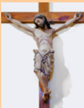
Terradillos de los Templarios

En Ledigos su iglesia dedicada al apóstol se eleva sobre un pequeño altozano desde el que se ve Terradillos de los Templarios . El nombre de la localidad se asocia al Temple del que fue señorío y a una curiosa leyenda de la gallina de los huevos de oro. Termina nuestro recorrido jacobeo en tierras palentinas tras pasar por las localidades de Moratinos y San Nicolás del Real Camino