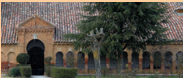
Pozuelos del Rey

Era con sobrio artesanado; la iglesia de San Fructuoso (B.I.C.) con su torre gótico-mudéjar y la iglesia de Santa María que cuenta con una grandiosa capilla barroca dedicada a Jesús Nazareno. Desde aquí por la comarcal 611 llegaremos a Pozuelos del Rey y visitaremos la iglesia de Santiago Apóstol , enlazando a través de Gral de Campos con el Camino Francés en Sahagún.