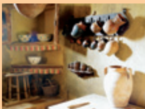
General San Martín. Busto y Casa-Museo.

Seguiremos hacia Cervatos de la Cueva donde visitaremos la casa-museo del General San Martín (B.I.C.), héroe y libertador de Latinoamérica. A él está dedicado un monumento en la plaza mayor. De los antiguos templos sólo quedan sus torres, ya que la nueva iglesia de tipo colonial fue costeadada en el siglo XX por la República Argentina.