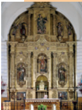
Revenga de Campos. Retablo Mayor

Desde esta localidad hay dos itinerarios igualmente transitados, uno por Villovieco y Arconada que llega hasta Villasirga y otro que va desde Revenga y Villarmentero a Villasirga. En Revenga de Campos además de algunas casa blasonadas , veremos el monolito del General Amor , héroe de la Guerra de la Independencia y la iglesia de San Lorenzo con buenos retablos y una interesante puerta con pliegues de servilleta del siglo XV.