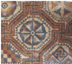
Mosaicos e hipocaustum.

A la salida de esta localidad podremos seguir el trazado de la N-120 y con ello el Camino Francés o seguir por la carretera P-972 por el ramal del Camino que nos conducirá hasta Villada. Si seguimos por la N-120, la misma que venimos recorriendo desde Carrión, llegaremos a Quintanilla de la Cueva , en cuyo término municipal se encuentra la Villa Romana de la Tejada . Es uno de esos fundi romanos de uso agrícola del siglo II, cuyo esplendor discurrió a lo largo de los siglos III y IV. Son visitables varias salas que conservan in situ unos magníficos mosaicos, la piscina y los hipocaustos, origen de las famosas "glorias" castellanas.