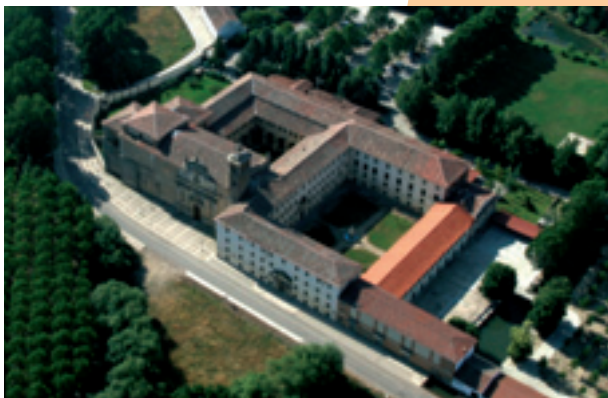
Monasterio de San Zoilo. Vista aérea.

En la parte baja de la ciudad y extramuros se encuentra el que fuera Monasterio de San Zoilo (B.I.C.) . En su visita se aprecia los diferentes estilos artísticos en los que ha sido reconstruido con el paso de los siglos. Románica es parte de su torre y la portada de los pies de su iglesia, al igual que algunos sepulcros. Hay sepulturas góticas, buenas pinturas, retablo y un órgano barroco. Pero por lo que destaca este antiguo cenobio es por su grandioso claustro renacentista, que es uno de los mejores de España.