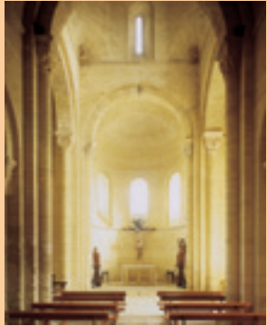
San Martín. Interior.