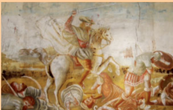
Ledigos. Pintura mural