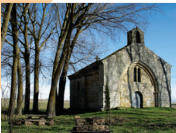
Población de Campos. Ermita de San Miguel

Desde esta localidad hay dos itinerarios igualmente transitados, uno por Villovieco y Arconada que llega hasta Villasirga y otro que va desde Revenga y Villarmentero a Villasirga. En Revenga de Campos además de algunas casa blasonadas , veremos el monolito del General Amor , héroe de la Guerra de la Independencia y la iglesia de San Lorenzo con buenos retablos y una interesante puerta con pliegues de servilleta del siglo XV.