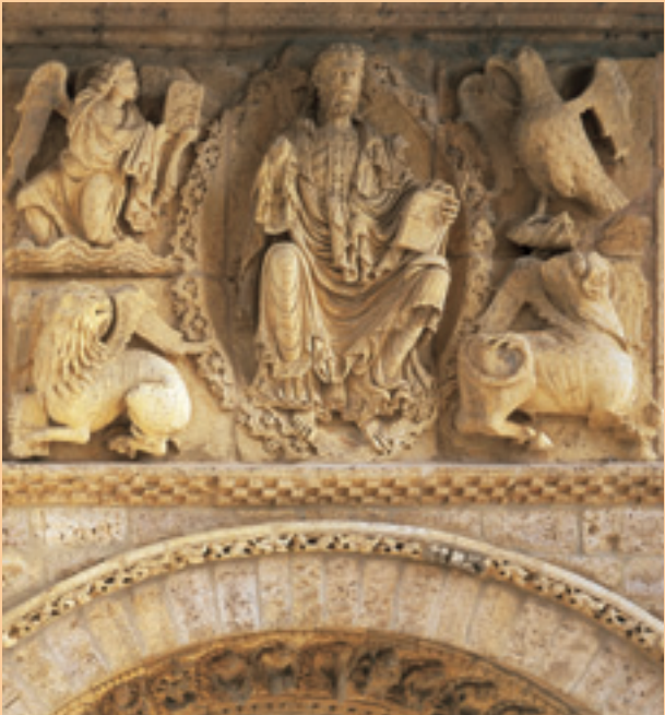
Iglesia de Santiago. Pantócrator.

La iglesia-museo de Santiago (B.I.C.) obra de finales del siglo XII, posee una fachada que muestra el románico en todo su esplendor. Un gran Pantócrator, rodeado del Tetramorfos (los cuatro evangelistas) y con el apostolado bajo doseles trilobulados. En la arquivolta de la entrada 24 figuras de oficios medievales. Toda esta fachada presenta un trabajo sólo comparable con el Pórtico de la Gloria de la Catedral de Santiago de Compostela. Hoy en su interior hay un sugerente museo.