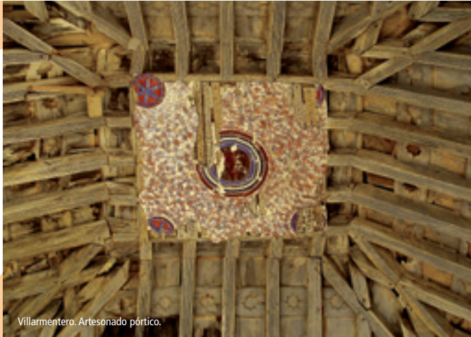
Villarmentero. Artesonado pórtico.

En la pequeña localidad de Villarmentero de Campos el templo parroquial de San Martín de Tours, nos recuerda viejas leyendas de la peregrinación con una mula por protagonista llevando bajo su lomo las reliquias del santo. Destaca del templo su artesonado y el retablo mayor.