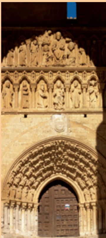
Villalcázar de Sirga. Igl. Sta. María. Pórtico sur.

En Villácazar de Sirga , la iglesia de Santa María la Blanca (B.I.C.) domina el caserío. Construida en el siglo XIII, alberga en su interior la imagen de la Virgen a la que cantó en las Cantigas el, rey Alfonso X el Sabio y de la que tan devoto era Sancho IV el Bravo. Lo más espectacular son además de las esculturas del pórtico y otras del interior, los sepulcros del Infante don Felipe, hijo de Fernando III el Santo y el de su segunda esposa. Son dos sepulturas góticas, con policromía, que nos acercan a el ambiente medieval de la época de su realización, al representar el cortejo del funeral de los aquí enterrados. Igualmente destaca el gran retablo mayor de 27 pinturas sobre tabla del siglo XV, presidido por un gran Calvario gótico de hacia 1300.