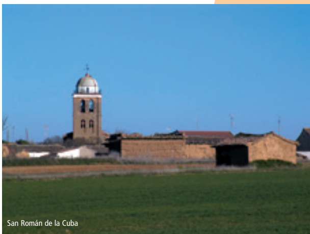
San Román de la Cuba