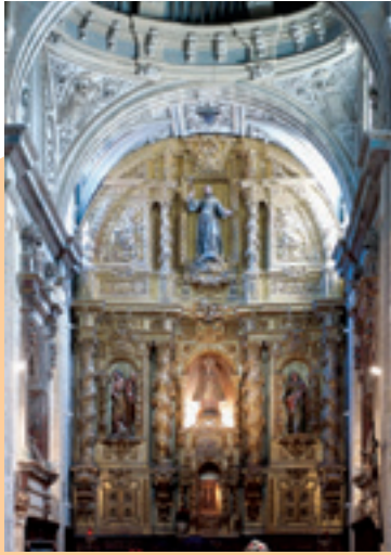
Iglesia de Santa María del Camino

La iglesia de Santa María de las Victorias o del Camino (B.I.C.) es el templo más antiguo de la localidad. Románica de inicios del siglo XII, su construcción al parecer está vinculada al famoso "Tributo de las Cien Doncellas". En su interior destacan las esculturas góticas de Santa María y el Cristo del Amparo.