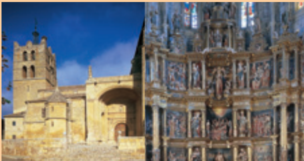
Santoyo. Retablo Mayor