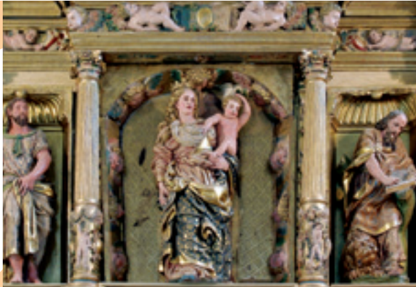
Calzadilla de la Cueva. Detalle retablo.