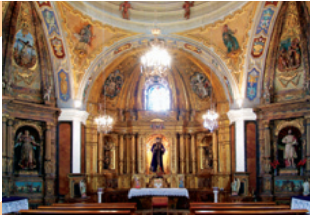
Villada. Capilla de Jesús Nazareno.

Era con sobrio artesanado; la iglesia de San Fructuoso (B.I.C.) con su torre gótico-mudéjar y la iglesia de Santa María que cuenta con una grandiosa capilla barroca dedicada a Jesús Nazareno. Desde aquí por la comarcal 611 llegaremos a Pozuelos del Rey y visitaremos la iglesia de Santiago Apóstol , enlazando a través de Gral de Campos con el Camino Francés en Sahagún.