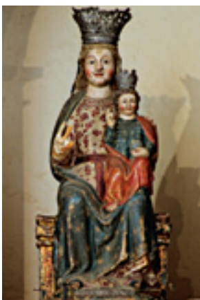
Pozo de Urama. Virgen.

Desde Cervatos de la Cueva parte un ramal que va por San Román de la Cuba donde podremos visitar la iglesia de San Juan Bautista . Continuaremos hacia Pozo de Urama , lugar de nacimiento del pintor Juan Manuel Díaz Caneja. Desde aquí nos encaminamos a Villada , lugar donde nació el pintor Casado del Alisal y donde son varios los templos que podemos visitar como: la ermita de la Virgen del Río ; la del Cristo de la