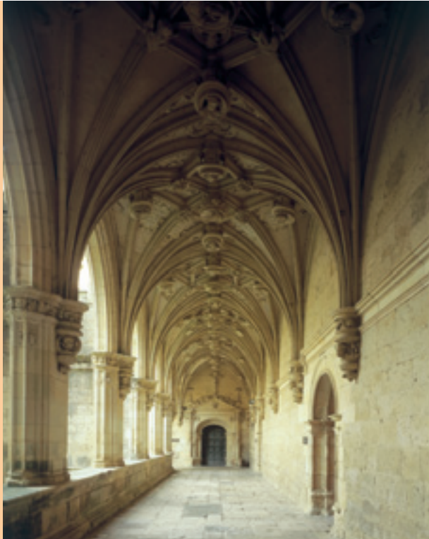
Monasterio de San Zoilo. Claustro

En la parte baja de la ciudad y extramuros se encuentra el que fuera Monasterio de San Zoilo (B.I.C.) . En su visita se aprecia los diferentes estilos artísticos en los que ha sido reconstruido con el paso de los siglos. Románica es parte de su torre y la portada de los pies de su iglesia, al igual que algunos sepulcros. Hay sepulturas góticas, buenas pinturas, retablo y un órgano barroco. Pero por lo que destaca este antiguo cenobio es por su grandioso claustro renacentista, que es uno de los mejores de España.