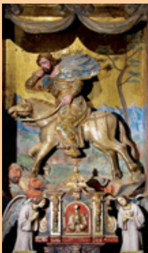
Santiago "Matamoros". Calzada de los Molinos.

Después de salir del monasterio nos encaminamos hacia la zona llamada de la Cueva. Los peregrinos seguían hacia la antigua Abadía de Benevívere y cruzando sobre la Via Aquitana se encaminaban hacia Calzadilla de la Cueva. Nosotros seguiremos el trazado de la N.120 y llegaremos a Calzada de los Molinos , donde nos detendremos a ver la iglesia de Santiago, con un bello artesonado mudéjar en la capilla mayor y un retablo renacentista con una curiosa representación de Santiago Matamoros.