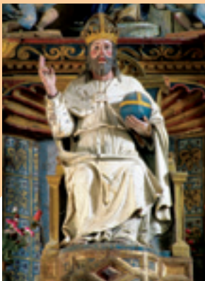
Salvador. Retablo Mayor de Quintanilla.

A la salida de esta localidad podremos seguir el trazado de la N-120 y con ello el Camino Francés o seguir por la carretera P-972 por el ramal del Camino que nos conducirá hasta Villada. Si seguimos por la N-120, la misma que venimos recorriendo desde Carrión, llegaremos a Quintanilla de la Cueva , en cuyo término municipal se encuentra la Villa Romana de la Tejada . Es uno de esos fundi romanos de uso agrícola del siglo II, cuyo esplendor discurrió a lo largo de los siglos III y IV. Son visitables varias salas que conservan in situ unos magníficos mosaicos, la piscina y los hipocaustos, origen de las famosas "glorias" castellanas.