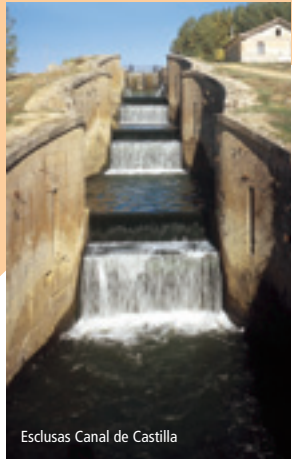
Esclusas Canal de Castilla

Desde Santoyo o desde Boadilla, nos dirigiremos a Frómista , "la Villa del Milagro". El recorrido monumental en la villa se inicia en las esclusas del Canal de Castilla. Desde allí visitaremos la ermita de la Virgen del Otero y el templo de Santa M a del Castillo (B.I.C.) y la iglesia parroquial de San Pedro, donde en un pequeño museo veremos las famosas 29 tablas del retablo de Santa M a del Castillo obra del siglo XV.