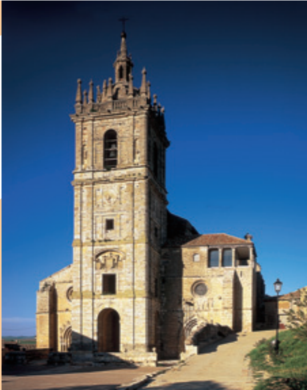
Támara de Campos. San Hipólito el Real

Saliéndonos del Camino, por un desvío histórico empleado por los peregrinos cuando crecía en exceso el río Pisuerga podremos visitar la pequeña localidad de Támara de Campos y su gran iglesia de San Hipólito el Real (B.I.C.), casi una catedral. A tan sólo 5 km. visitaremos Santoyo , cuyo templo de San Juan Bautista (B.I.C.) posee un gran ábside con un retablo renacentista majestuoso, artesonado mudéjar policromo en su sotocoro y un magnífico órgano. También podremos visitar el Centro de Interpretación del Palomar de Tierra de Campos .