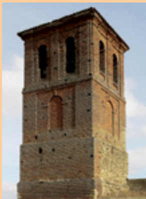
Quintanilla de la Cueva. Torre mudéjar.